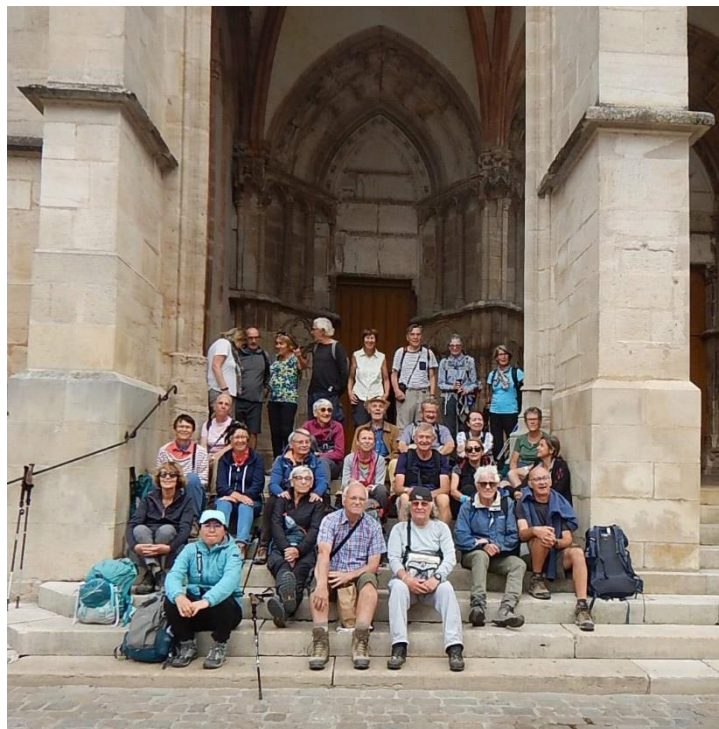
Photo du groupe

Un dernier tronçon nous conduit au pied de la ville de Semur-en-Auxois pour une visite de la Collégiale Notre-Dame, et après une photo de groupe et le déjeuner, quartier libre pour apprécier et visiter les remparts de la vieille ville.